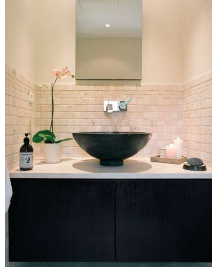
Une vasque et un meuble noir pour la masculinité, des murs aux douces couleurs pour la féminité.

Les anciens propriétaires avaient souhaité donner à cette maison le confort et la décoration attendus dans une maison de vacances, un beau carrelage, des commodités et une décoration simple mais élégante. Les nouveaux acquéreurs ont clairement manifesté leur souhait de transformer leur demeure en mas chic et confortable sans perdre son cachet provençal. Ainsi, l'ancienne terrasse, couverte, agrandit le salon et a été dotée d'un très beau sol en pierres. Deux petites chambres ont été réunies pour donner naissance à la chambre de maître avec son dressing, son coin salon et une salle de bains attenante. Dans la chambre d'amis, un camaïeu de coloris coquille d'œuf et crème invite à la détente. Les salles de bains sont en revanche, résolument contemporaines.