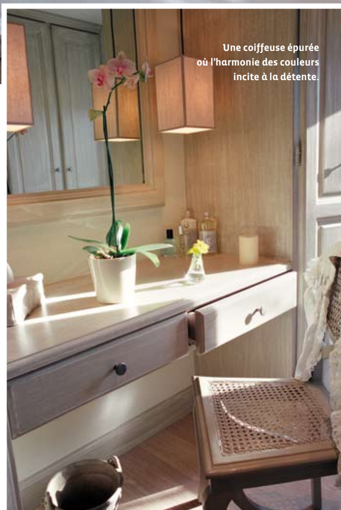
Une coiffeuse épurée où l'harmonie des couleurs incite à la détente.

Les anciens propriétaires avaient souhaité donner à cette maison le confort et la décoration attendus dans une maison de vacances, un beau carrelage, des commodités et une décoration simple mais élégante. Les nouveaux acquéreurs ont clairement manifesté leur souhait de transformer leur demeure en mas chic et confortable sans perdre son cachet provençal. Ainsi, l'ancienne terrasse, couverte, agrandit le salon et a été dotée d'un très beau sol en pierres. Deux petites chambres ont été réunies pour donner naissance à la chambre de maître avec son dressing, son coin salon et une salle de bains attenante. Dans la chambre d'amis, un camaïeu de coloris coquille d'œuf et crème invite à la détente. Les salles de bains sont en revanche, résolument contemporaines.